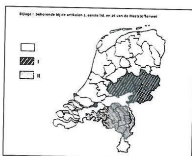
Concentratiegebieden Oost en Zuid uit de Meststoffenwet

Het Rijk heeft in het regeerakkoord 200 miljoen euro beschikbaar gesteld voor een vrijwillige Warme Sanering Varkenshouderij (ook wel Saneringsregeling Varkenshouderij; SRV). Deze SRV geldt in gebieden met een hoge vee dichtheid (de concentratiegebieden als aangegeven in bijlage I bij de Meststoffenwet, zie afbeelding). Met als doel de kwaliteit van de leefomgeving in deze gebieden te verbeteren. In combinatie met de sanering wordt een stimuleringsprogramma voor verduurzaming van blijvende veehouderijen uitgevoerd. Voor de daadwerkelijke sanering is 120 miljoen euro beschikbaar, voor innovatie en verduurzaming is 60 miljoen euro beschikbaar. De overige 20 miljoen zijn gereserveerd voor voorbereidings- en uitvoeringskosten.